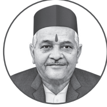
प.पू. भक्तराज महाराज, इंदूर