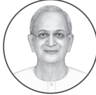
सच्चिदानंद परब्रह्म डॉ. जयंत आठवले